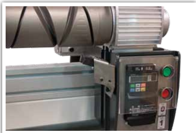
Motor y variador de velocidad de corriente alterna individual para cada cabezal Moteur et variateur de vitesse de courant alternatif individuel pour chaque broche Motor and variator of speed individual for each spindle Motore ed variatore di velocità di corrente alterna individuale per ogni testa