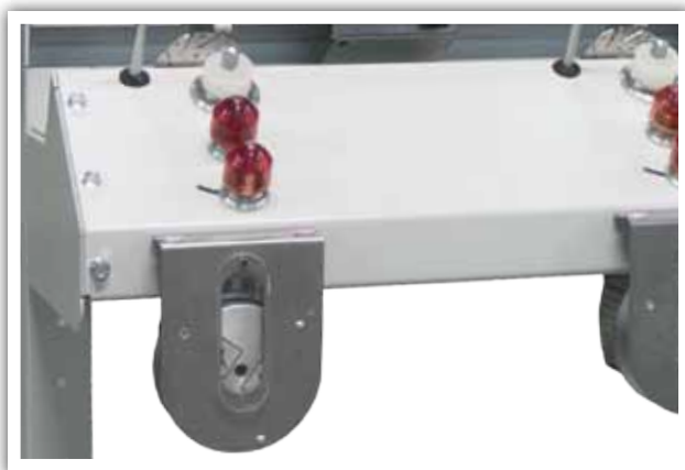
Alimentador positivo Alimentateur positif Positive feeding Alimentatore positivo

Bobinadora modular de 5 cabezales ampliable hasta un máximo de 50, para hilaturas, tintorerías y tejedurías. Pensada para repasar, purgar y parafinar hilos.