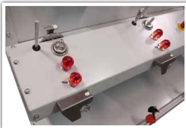
Grupo tensor - purgador - parafinador Groupe tendeur - purgeur - paraffineur Tension - clearing - waxing group Grupo di tensiore - sribbia - paraffinatore